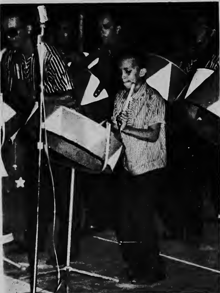
Esaki ta un di e steelbandnan di Santa Cruz, cual tambe a competi den e concurso di steelband organisa door di C.C. C.A. E "First play- er" di e steelband aki a hala hopi atencion door di cu e ta un hoben ainda (centro) - pero cu ta forma un di e tocadornan principal di e steelband.